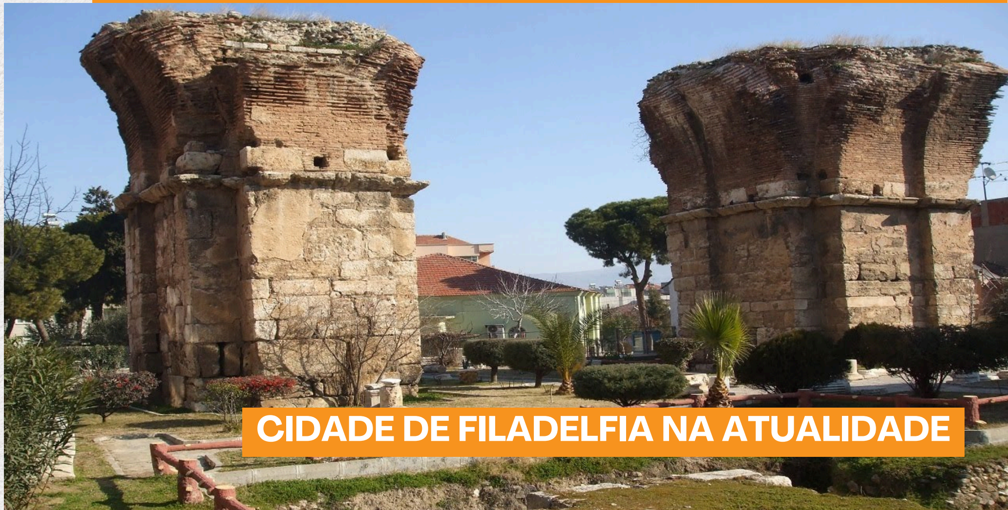
CIDADE DE FILADELFIA NA ATUALIDADE

Nesse ambiente hostil, a igreja enfrentava perseguição constante. Havia grupos que queriam fechar as portas daquela comunidade.